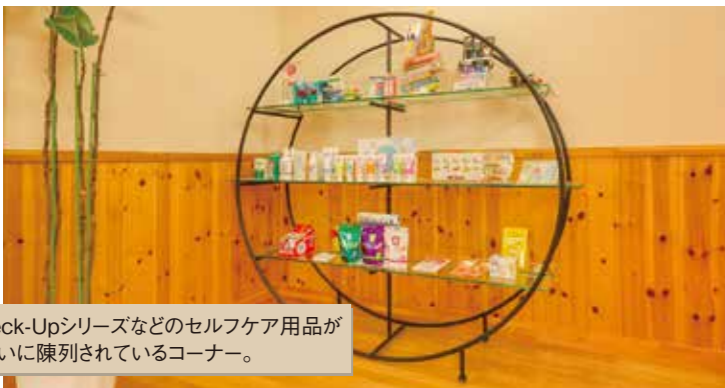
Check-Upシリーズなどのセルフケア用品がきれいに陳列されているコーナー。