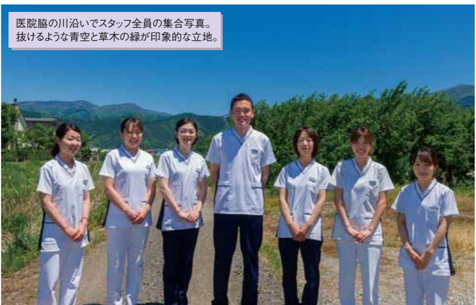
医院脇の川沿いでスタッフ全員の集合写真。抜けるような青空と草木の緑が印象的な立地。

地域に必要なのは、歯を治すだけの歯科医院ではなく、歯を守ることでできる歯科医院だと私は考えています。そのためには、それぞれ役割は違いますが、歯科医師、歯科衛生士、受付という全てのスタッフが「歯を守る」という同じ目標に向かって進んでいかなくてはなりません。院長のぶれない姿勢は、いずれスタッフ全員の姿勢となり、やがては来院患者さんも含めた医院全体のカラーを生み出すはずです。当院が予防歯科を求めている患者さんにとって、なくてはならない医院になれるよう、今後もスタッフ一丸となって取り組んでいきたいと思っています。