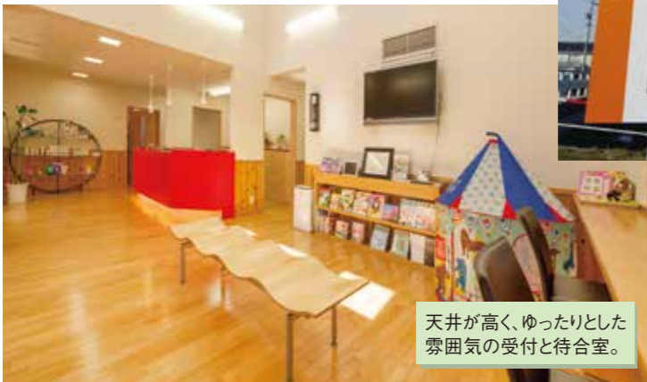
天井が高く、ゆったりとした雰囲気の受付と待合室。